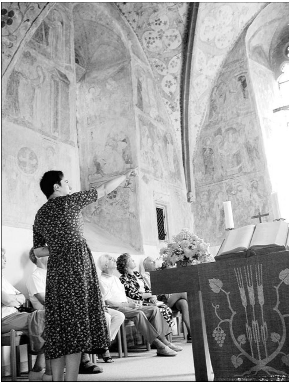
Das älteste Bauwerk in Waiblingen-Neustadt ist die Martinkirche im Unterdorf; sie stand beim „Tag der offenen Tür“ im September 1999 im Mittelpunkt des Schauens.