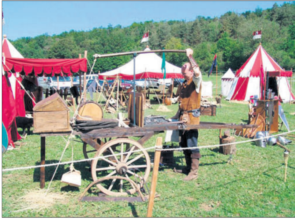
Das Waiblinger Altstadtfest wird 2007 zum ersten Mal von einem mittelalterlichen „Staufer-Spektakel“ begleitet: auf der Brühlwiese bieten Händler ihre Waren an, Handwerker zeigen, was im Mittelalter hergestellt wurde; Magier und Feuerspucker unterhalten Groß und Klein.

Abwassergebühr zum 1. Juli 2007 höher – Vier-Personen-Haushalt bezahlt im Jahr knapp 40 Euro mehr