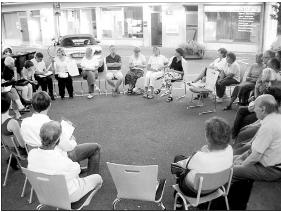
Der Danziger Platz – was sich dort bisher „abgespielt“ hat und was sich künftig dort tun soll, an diesen Überlegungen können die Bürgerinnen und Bürger innerhalb des Projekts „Soziale Stadt Waiblingen-Süd“ selbst mitwirken.