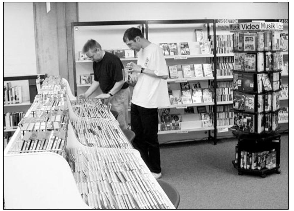
Bücher sind nicht das einzige Medium, das man in der Stadtbücherei Waiblingen im Marktdreieck ausleihen kann, auch CDs oder Videofilme gehören dazu.