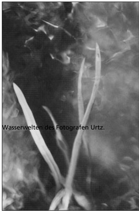
Wasserwelten des Fotografen Urtz.

Dies hat sich in den vergangenen 150 Jahren wesentlich dank des „neuen Sehens“ geändert