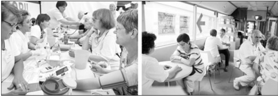
Die Kassenärztliche Vereinigung und SWR 4 haben am Freitag, 22. Juni 2007, auf dem Waiblinger Marktplatz über Gesundheitsvorsorge informiert.