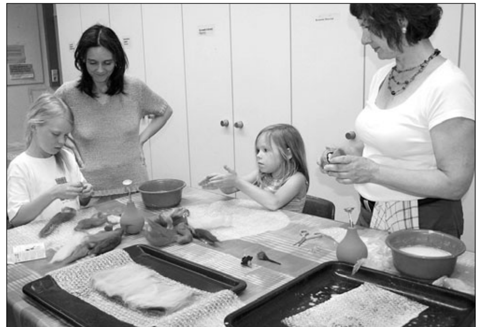
Das soll es künftig im Mehrgenerationenhaus auch geben – generationenübergreifende Angebote wie zum Beispiel gemeinsames Basteln. Bei der Eröffnung wurde schon fleißig gefitzt.